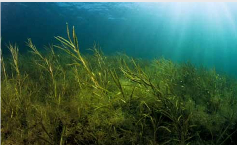
► Figura 1. Potamogeton alpinus .

Les espècies amb fulles surants només poden habitar zones somes però toleren la tènbolesa de l'aigua, mentre que les totalment submergides poden colonitzar fondàries majors però depenen de la transparència de l'aigua. Si les espècies amb fulles flotants proliferen desmesuradament fan disminuir la penetració de la llum i l'intercanvi de gasos a la resta de la columna d'aigua inhibint el creixement d'altres organismes fotosintètics.