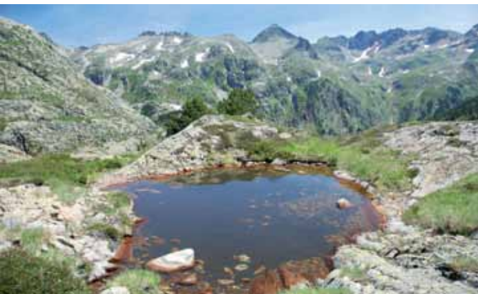
Bassa Romedos 2125 m (Pallars Sobirà).

Als estanys pirinencs hi ha una notable diversitat d'espècies. Característiques com l'altitud, la química de l'aigua o la mida marquen les espècies que hi poden viure. Des d'organismes que viuen suspesos en l'aigua formant part del plàncton (algues, puces d'aigua i copèpodes); passant per plantes, molluscs, cucs, insectes i amfibis que viuen al fons o al litoral; fins ocells i ratpenats que s'alimenten dels insectes que surten de l'aigua.