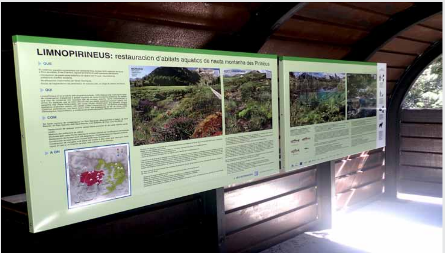
► Cartell informatiu sobre el LIFE LIMNOPIRINEUS.