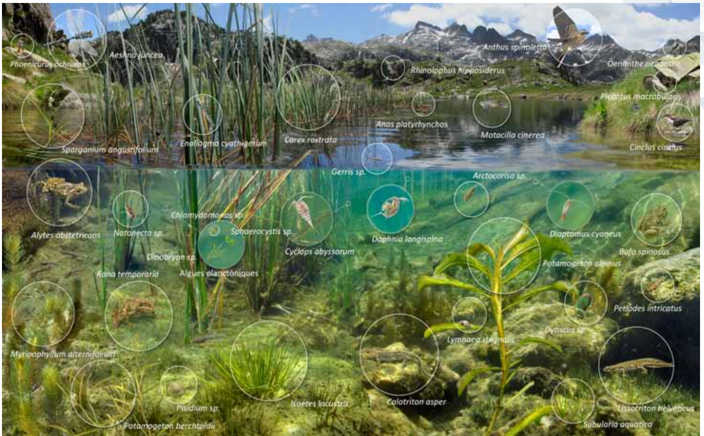
Il·lustració: T. Llobet