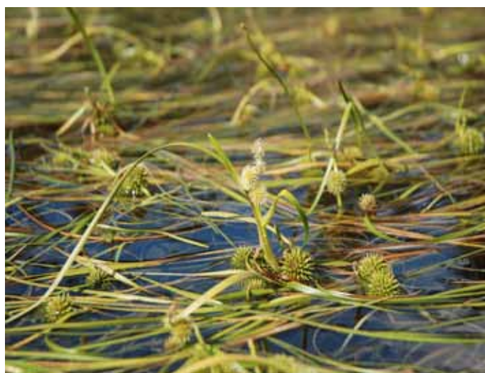
Figura 2. Sparganium angustifolium .

Isoetes lacustris és també molt comú i a més abundant quan s'assenta formant grans prats densos en sistemes d'aigües molt diluïdes i amb molt pocs nutrients (oligotròfia extrema). Isoetes echinospora prefereix aigües amb mineralització intermèdia i relativament oligotròfiques, i sobretot es situa a molt poca fondària i tolera l'emersió. Es acompanya sovint per la crucífera Subularia aquàtica a les aigües somes i sovint també a basses temporals.