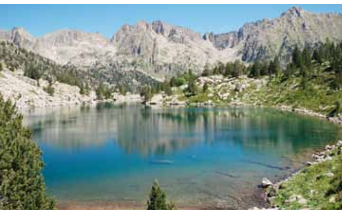
Estany de Subenuix 2194 m (Pallars Sobirà).