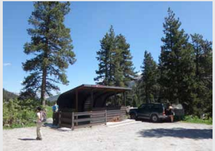
► Cartell en el punt d'arribada dels taxis.

Els cartells expliquen la riquesa natural dels ambients aquàtics d'alta muntanya, estanys, rius, molles i fonts carbonatades, i les accions de millora de l'estat de conservació d'aquests ambients al Parc Nacional d'Aigüestortes i Estany de Sant Maurici, al Parc Natural de l'Alt Pirineu i a l'Estanho de Vilac (Val d'Aran). Els cartells inclouen les descripcions en cinc idiomes, incloent l'Aranès, Català, Castellà, Anglès i Francès.