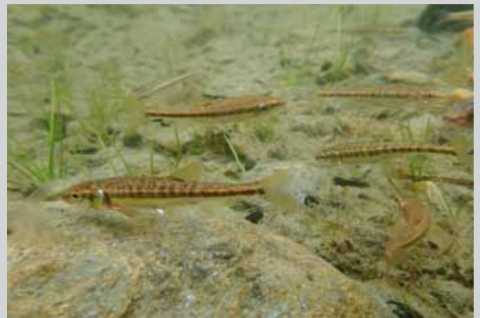
▶ El barb roig ( Phoxinus sp. ) és un petit ciprinid que ha estat introduït en una bona part dels estanys dels Pirineus.