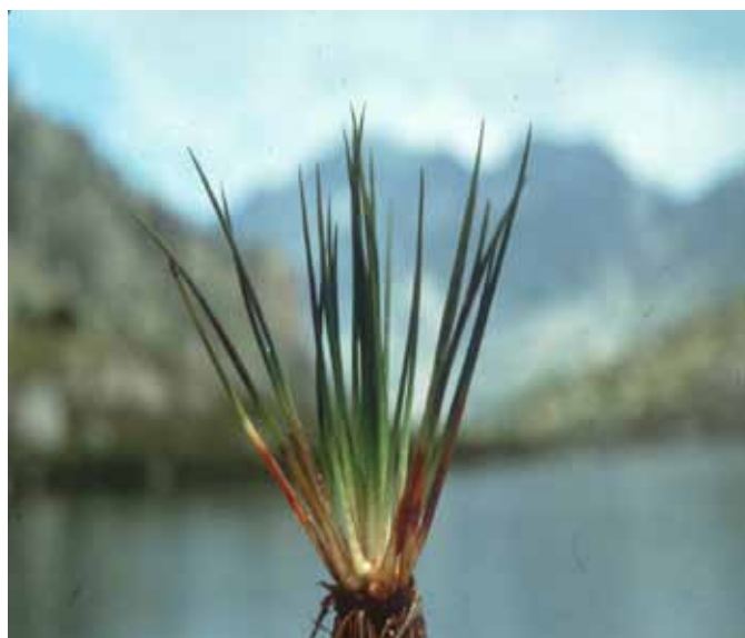
Figura 3. Isoetes lacustris .