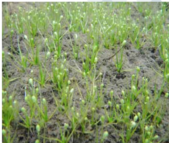
Figura 5. Subularia aquatica .

grollera, que es va fracturant gràcies a macro-invertebrats trituradors i a l'activitat microbiana. Talment com els arbres en un bosc.